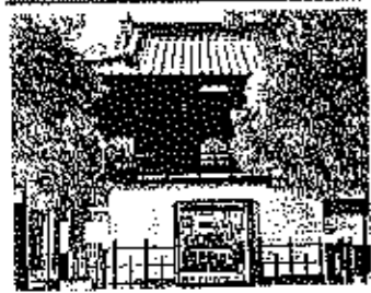
雲心寺の楼門 堂々として落ちついている。

雲心寺、興正寺ととも 名古屋三大仏の一角、阿彌陀 陀如来像がある。寺で 有名。文久二年(一八六二 年)の二階建てにわたる 楼門と、その右にもう ひとつ高麗門がある。 境内は緑も多くとても 静かな落ち着いた感じ。